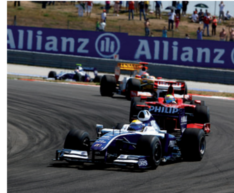
Fahren im Windschatten: Die Suche nach der besten Überholposition (GP Türkei 2009).

Ausschlaggebend für die Startposition eines Fahrers ist seine Qualifying-Zeit. Der Fahrer mit der schnellsten Rundenzeit startet von der Pole-Position. Die Autos stehen im 8-Meter-Abstand versetzt.