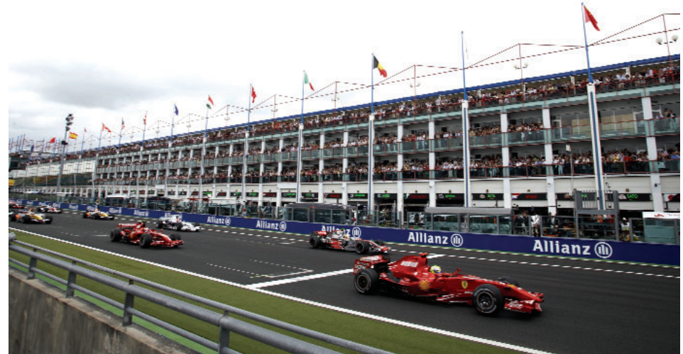
Pure Spannung, nachdem die Lichter erloschen (GP Europa 2007).

Die schlussendliche Entscheidung für eine Zeitstrafe, eine Durchfahrtsstrafe oder eine Zurückversetzung um 10 Plätze in der nächsten Startaufstellung treffen die Rennstewards, die offiziellen Rennschiedsrichter der Formel 1. Diese werden ab 2010 von einem Rennkommissar des nationalen Automobilverbandes und erfahrenen ehemaligen Formel 1-Piloten unterstützt. Zur Entscheidungsfindung können die Stewards Videomaterial und den Funkverkehr der Rennställe heranziehen.